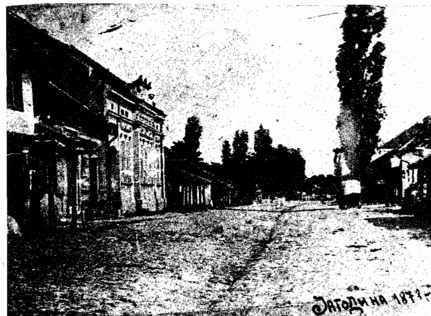
Јагодина, снимак једне улице недуго после смрти Светозара Марковића (1878. године). Овај град Марковић је сматрао, и тако га уносио у званична документа, својим завичајем, јер су му родитељи тамо имали кућу, а тамо су му живели најпре родитељи, потом маћеха, брат, снаха, сестре ....