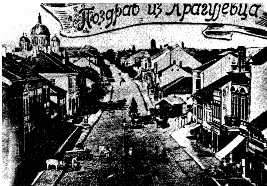
Крагујевац из доба Светозара Марковића. Снимак је настао нешто касније и штампан на разгледницама. Црква која се види на снимку грађена је за Марковићевог живота